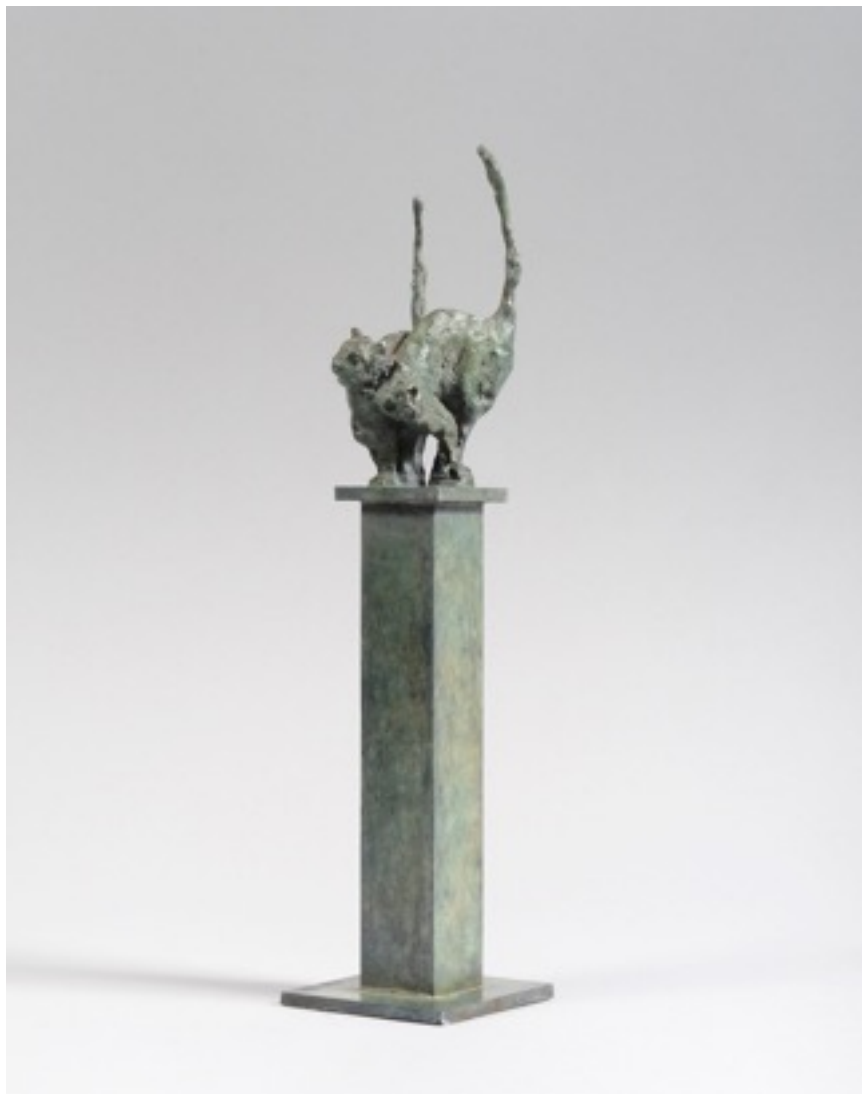
« Les deux chats » bronze H. 31 cm