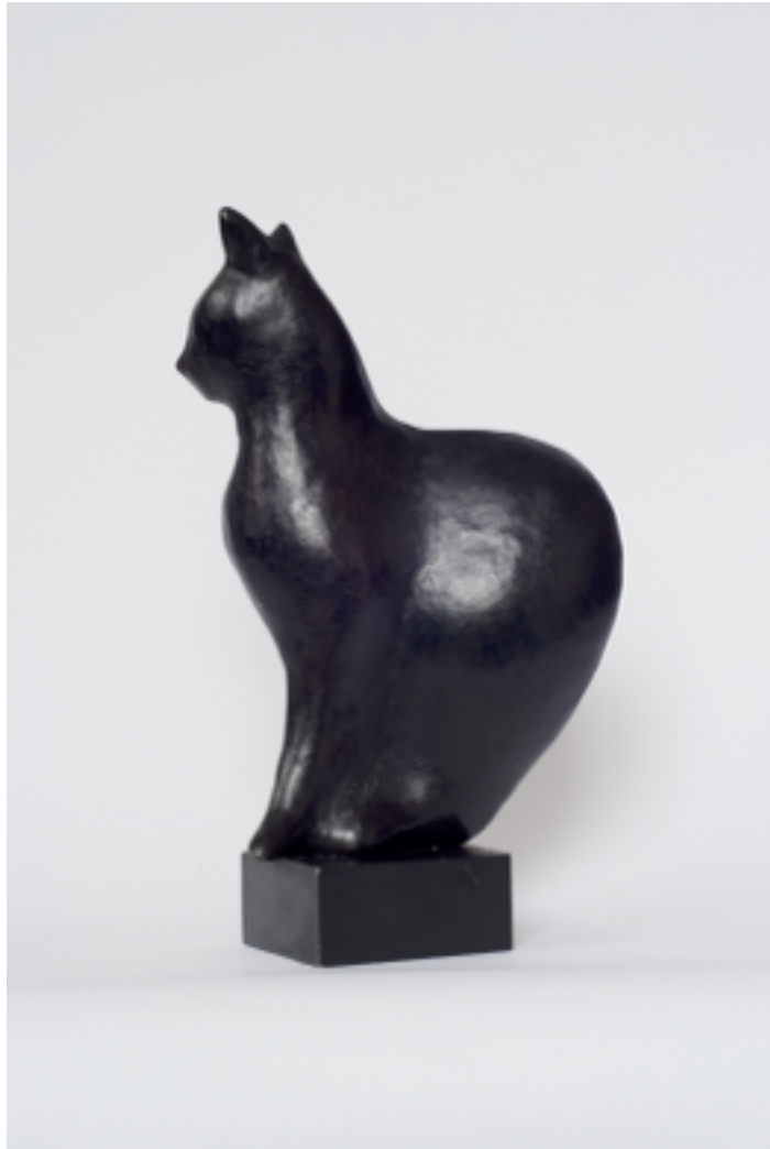
« Le Chat » 1984 bronze 35 x 23 x 7 cm