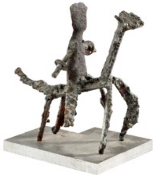
Robert Jacobsen, « Cavalier » fer soudé pièce unique H. 23 cm