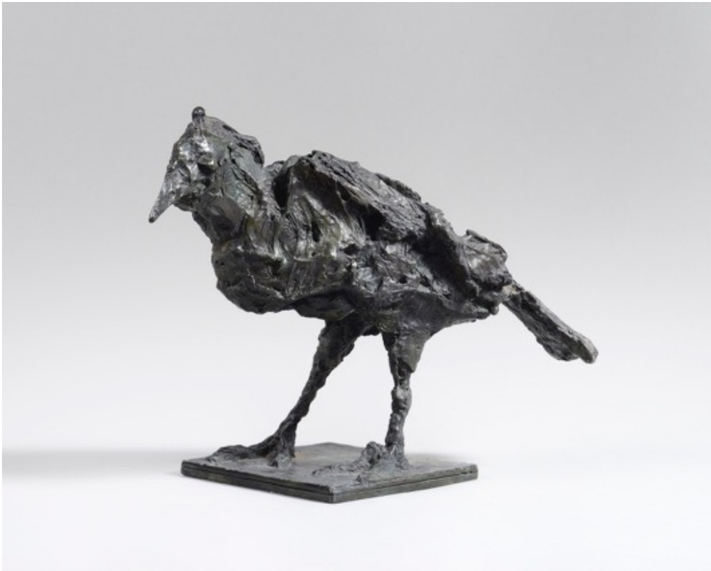
« Corbeau » bronze H. 28,5 cm