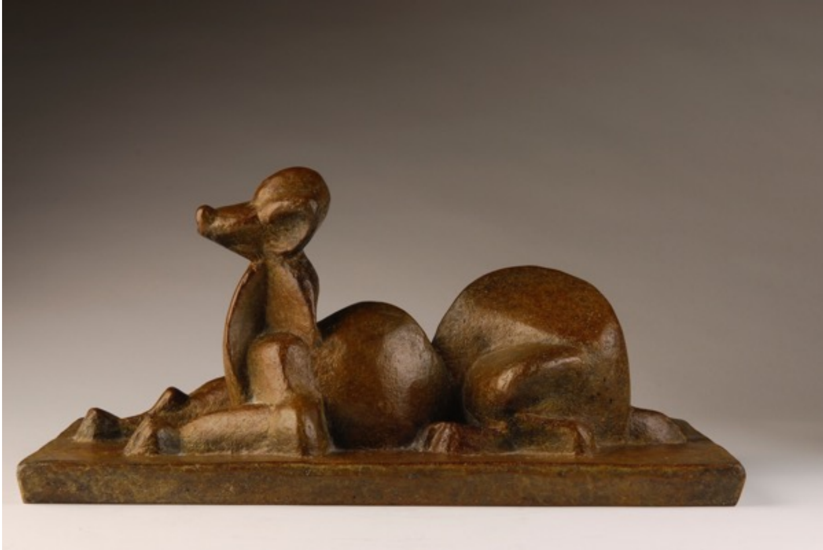
« Le chien couché » 1948 bronze 14 x 30 x 14 cm