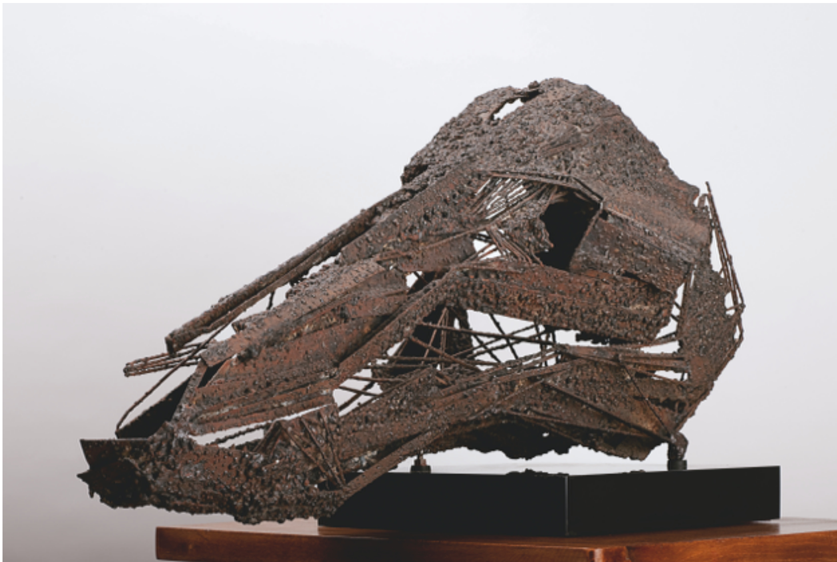
«Tête de cheval» 1955 métal soudé pièce unique 45 x 75 x 40 cm