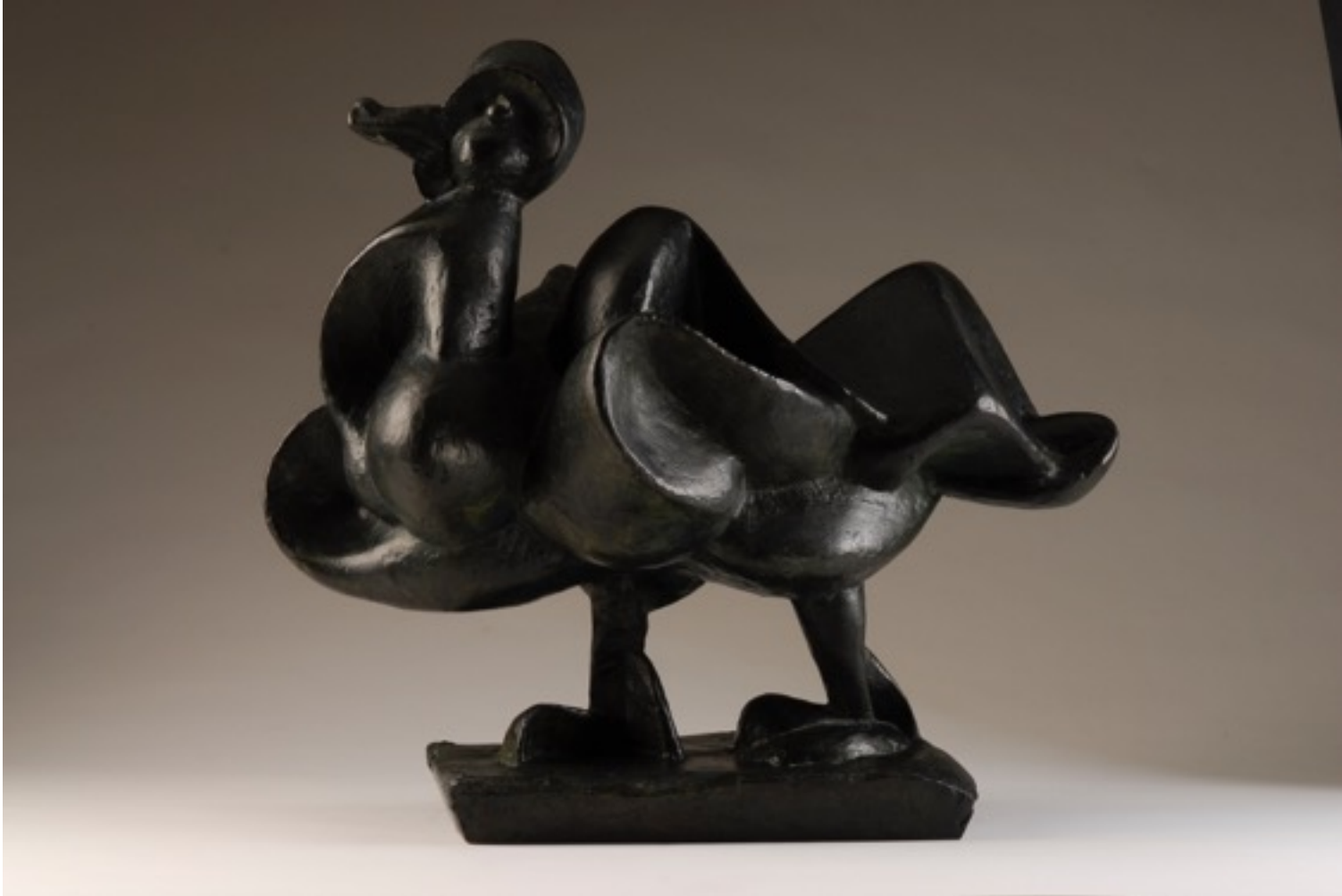
« Canard de Barbarie » 1947 bronze 44 x 49 x 33 cm