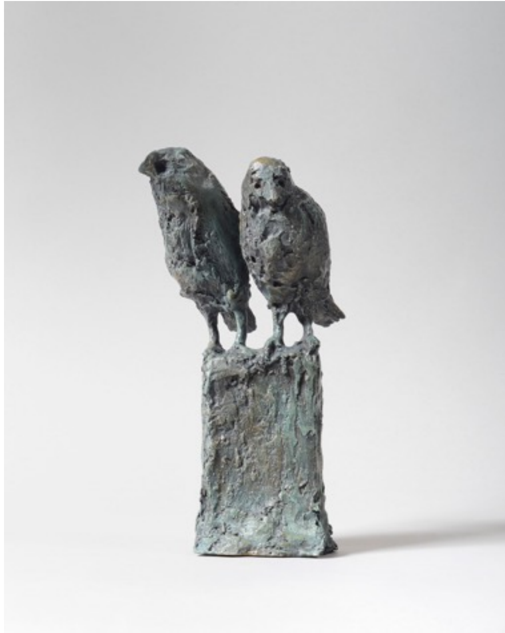
« Secret d'oiseaux » bronze H. 10 cm