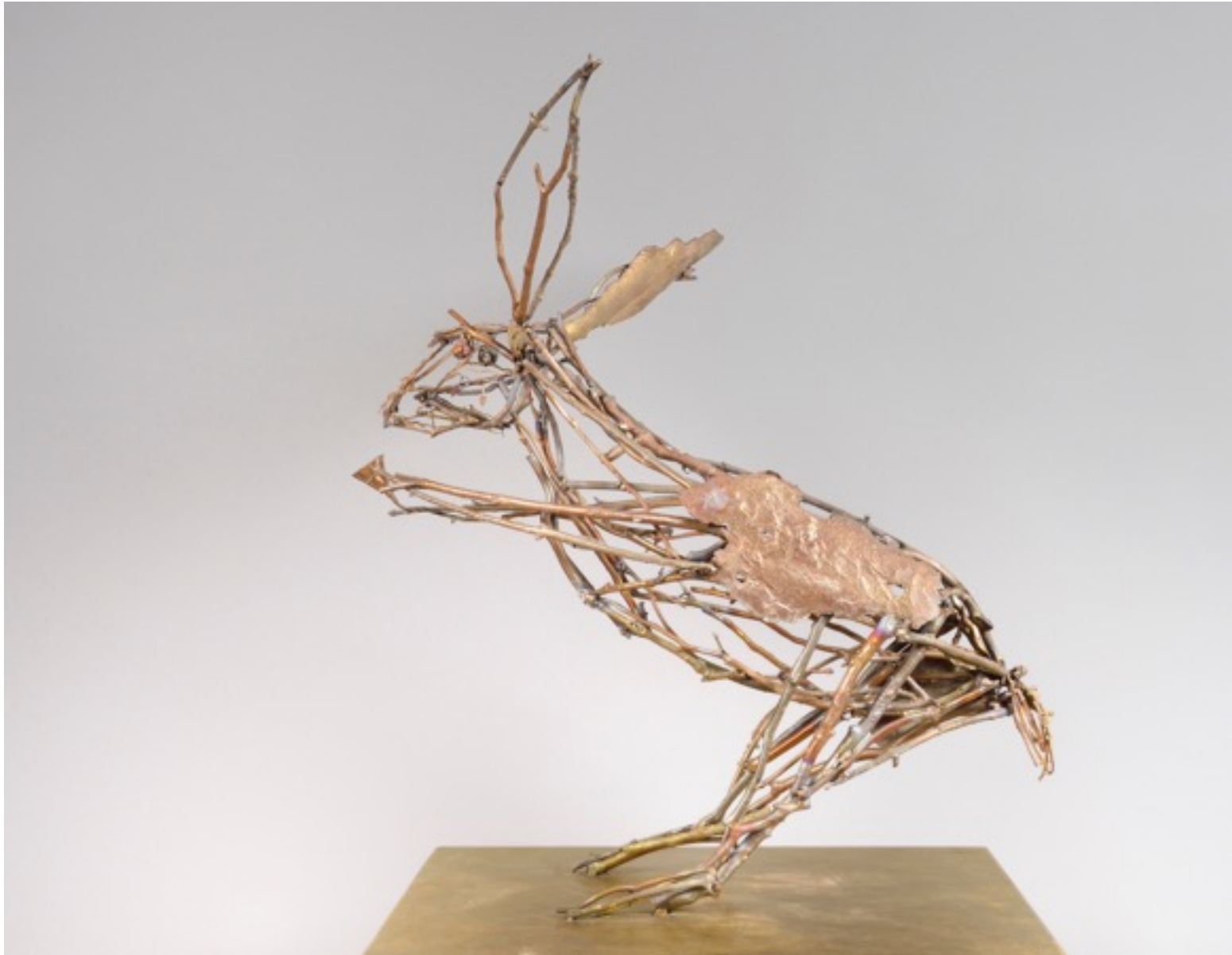
"Lièvre à la fleur » 2014 bronze pièce unique 92 x 57 x 85 cm