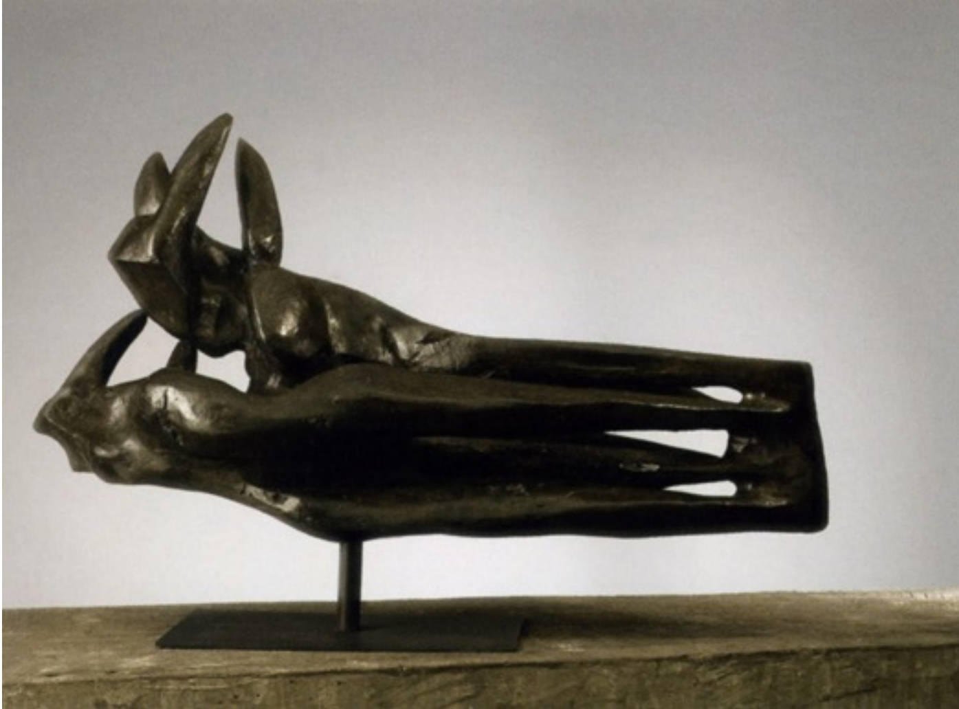
« Rhinocéros » 1969 bronze 31 x 69 cm