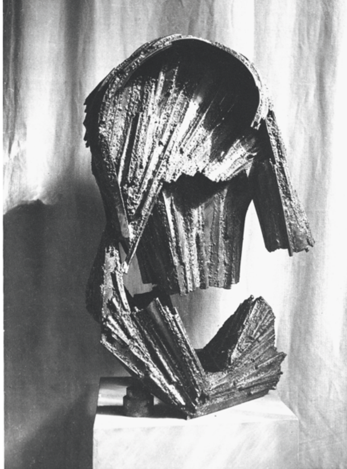
«Crâne d'animal préhistorique» 1955 acier pièce unique 65 x 35 x 45 cm