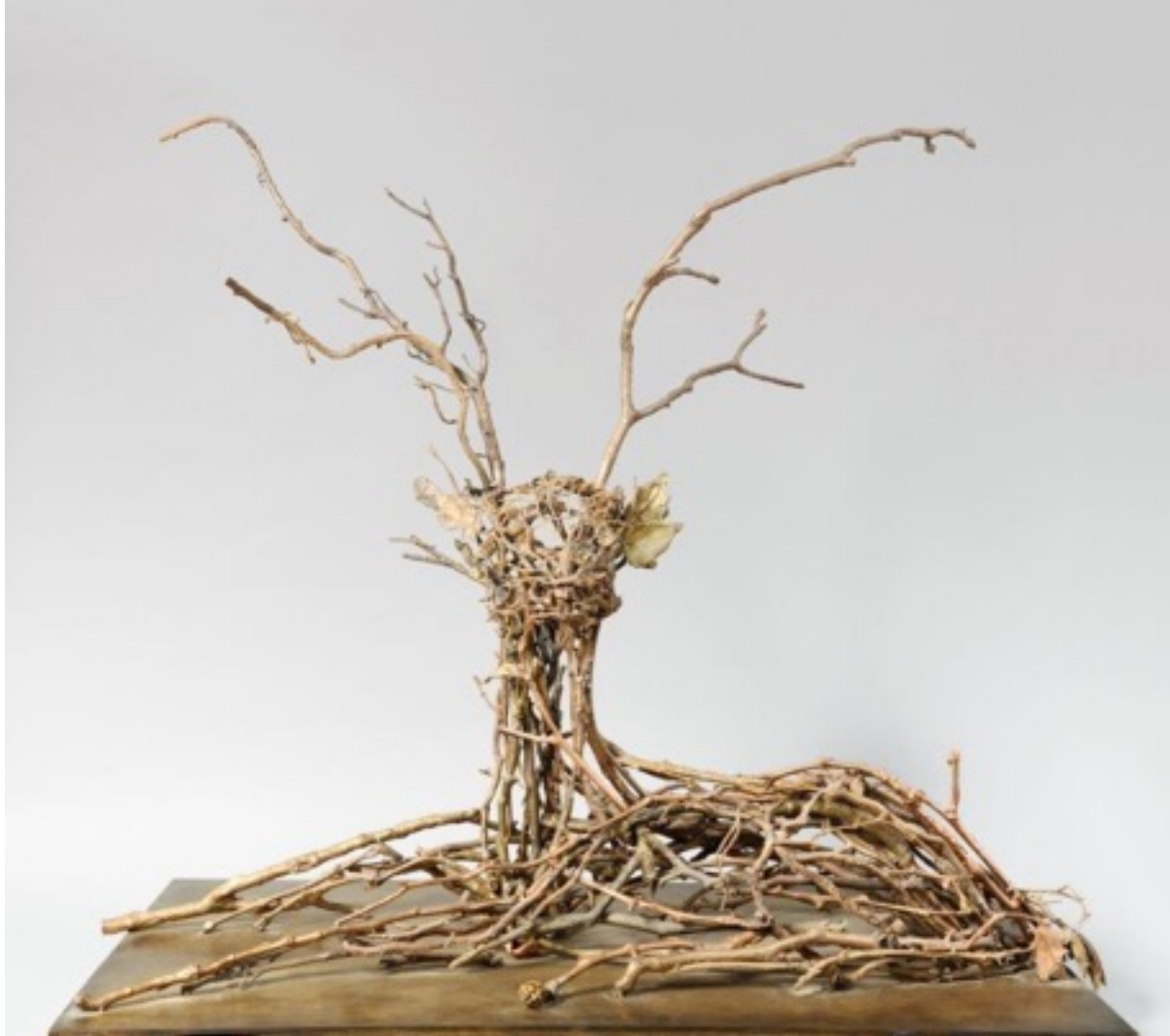
"Cerf à sa reposée » 2009 bronze pièce unique 110 x 50 x 100 cm