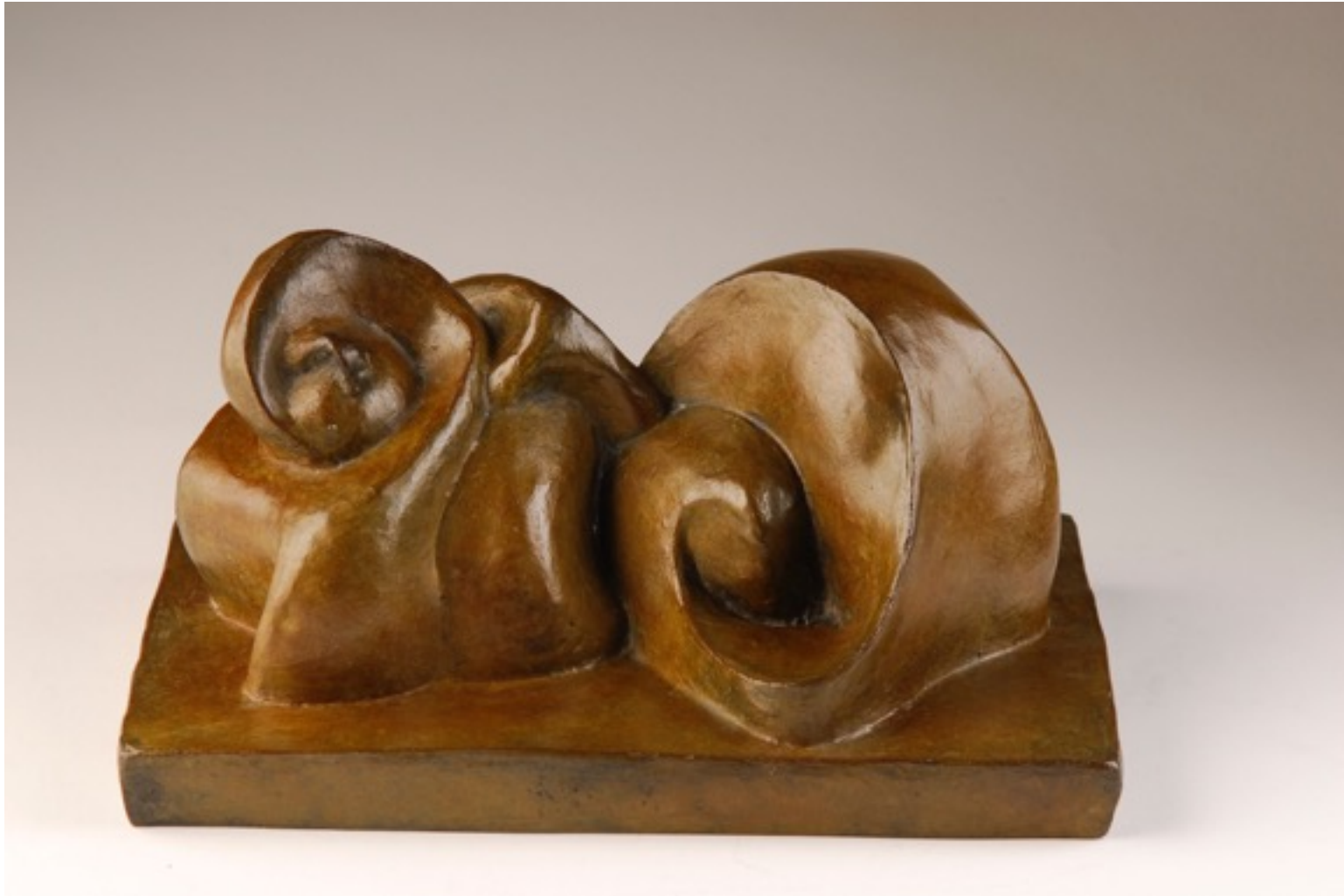
« Chat enroulé dans sa fourrure » 1947 bronze 12 x 22 x 15 cm